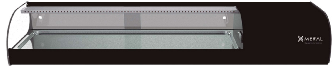
MERTAP 6 CUBA PLANA