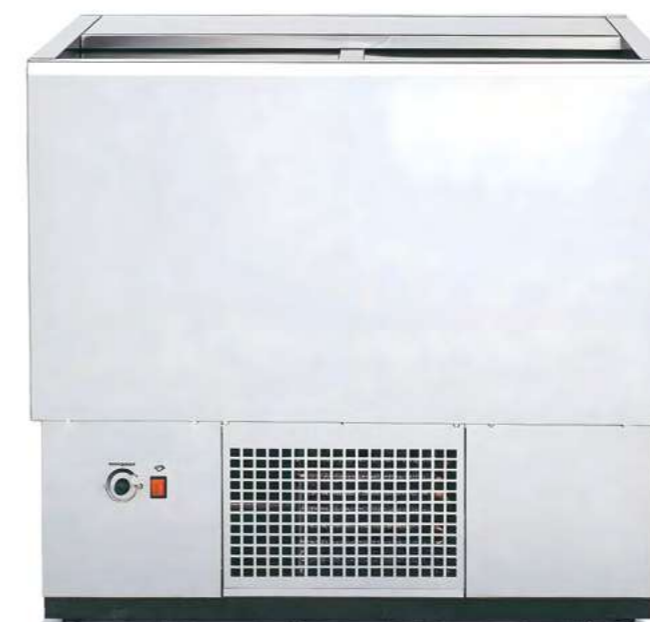
MESBOT 100 BLANCO