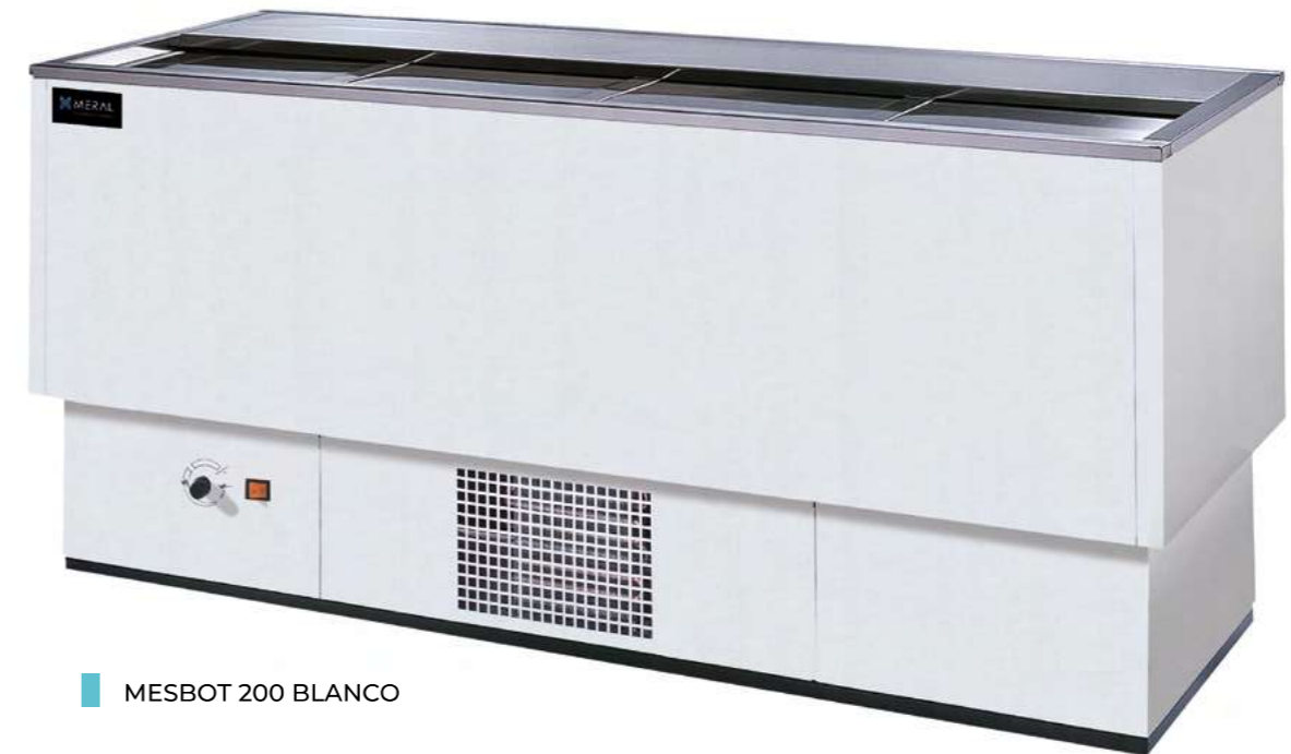
MESBOT 200 BLANCO