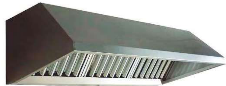
CAMPANA MURAL SNACK ECO