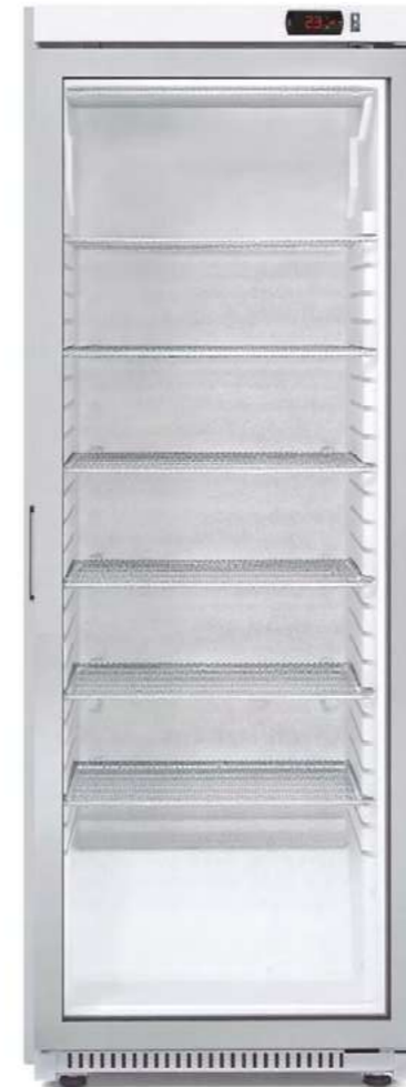
MERARMEX 399 BT