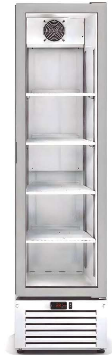
MERSLIM 440 BT