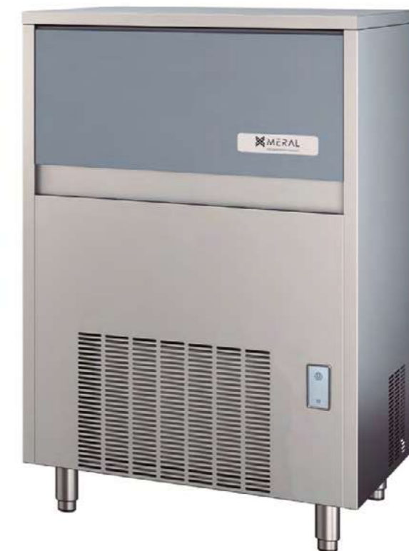
MERCUB 100 A-W