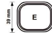
MERCUB 32 W