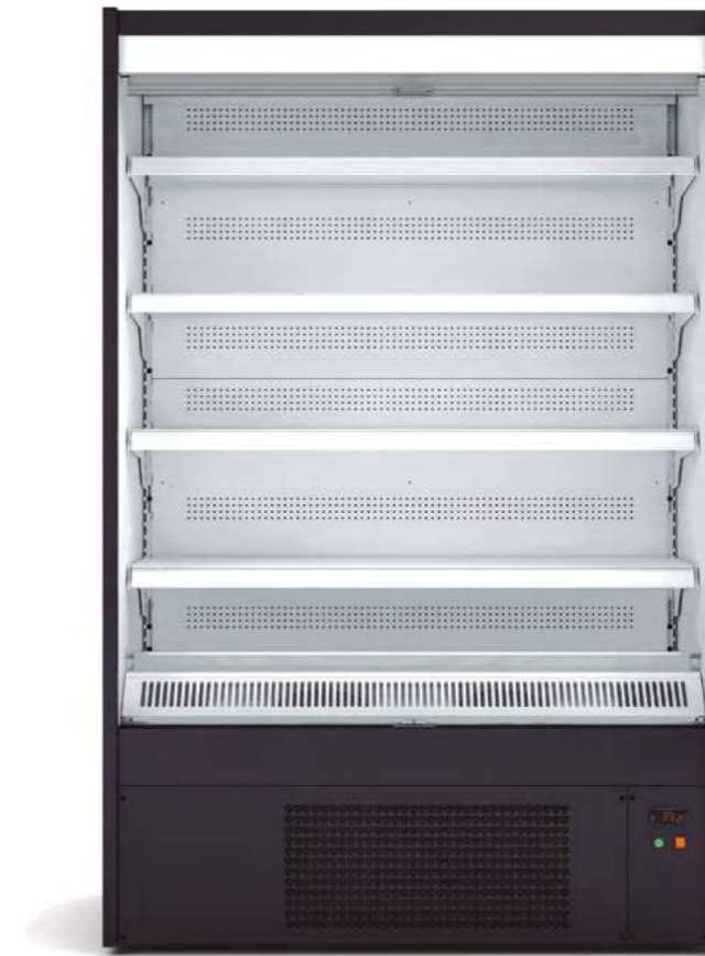
MERMUR 12 SIN PUERTAS