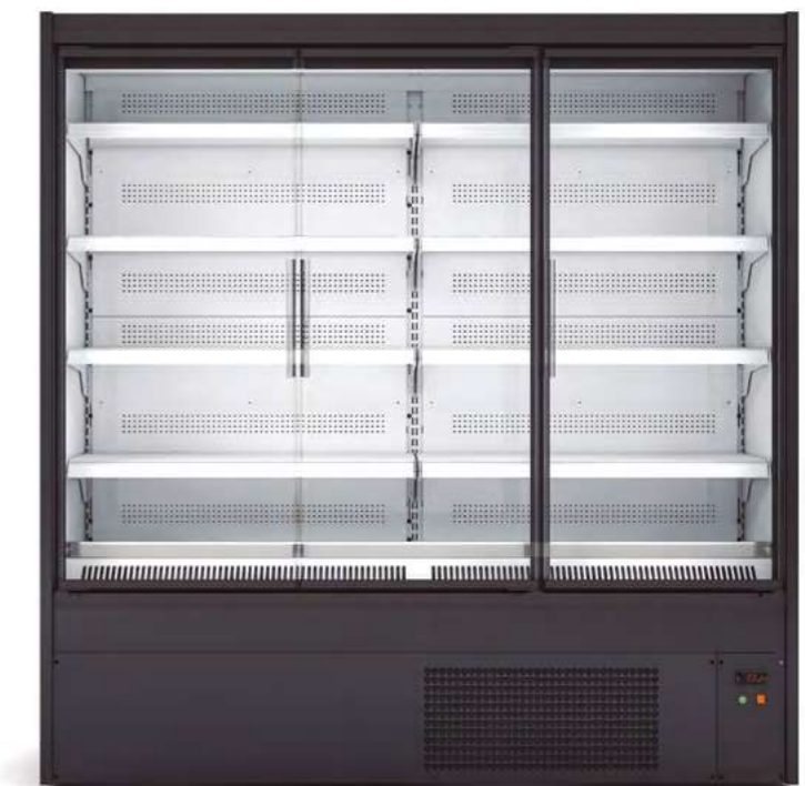
MERMUR 18 CON PUERTAS