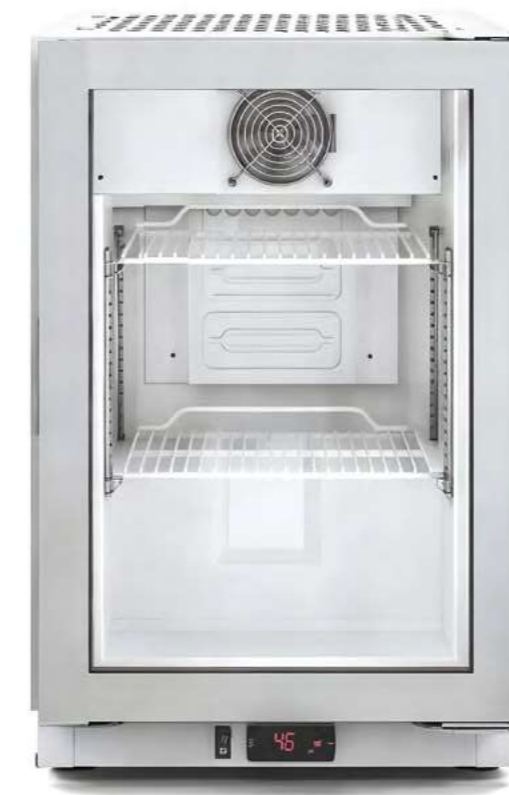
MERMINI 45 TN