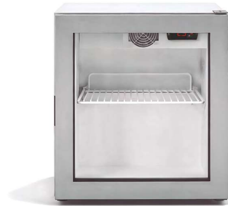
MERMINI 24 TN