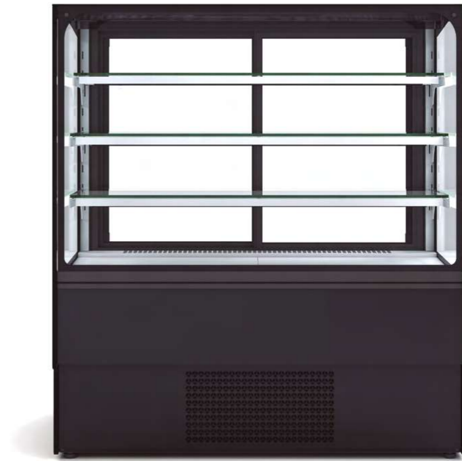
■ MERSEMUR 6-13