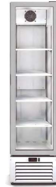
MERSLIM 440 TN