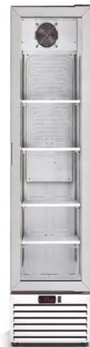
MERSLIM 370 TN