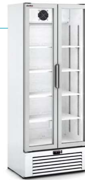
MERSLIM 2P TN