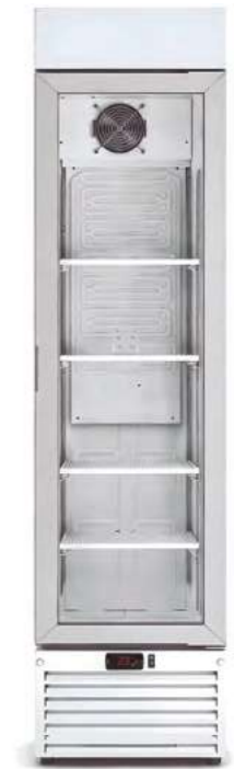
MERSLIM 370 TN C